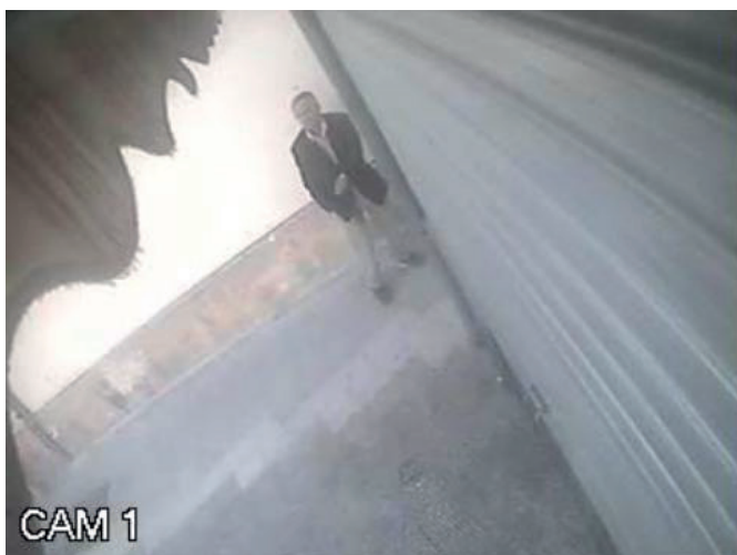
Figura 1 - Nell'attentato dinamitardo alla scuola "Falcone Morvillo" di Brindisi avvenuto nel 2012, il sistema di videosorveglianza di un'edicola inquadrava un soggetto. Le indagini si conclusero positivamente con l'identificazione del soggetto risultato poi il colpevole.

Ad esempio nell'attentato dinamitardo alla scuola "Falcone Morvillo" di Brindisi avvenuto nel 2012 e costato la vita ad una giovane studentessa, la determinazione dell'altezza risultò fondamentale per la riuscita delle indagini. In quel caso il sistema di videosorveglianza di un'edicola inquadrava un soggetto nei pressi della scuola ma la qualità delle immagini non ne permetteva il riconoscimento dalle caratteristiche del volto (Figura 1). Tuttavia la stima dell'altezza permise di appurare che doveva trattarsi di una persona particolarmente "bassa"; questa informazione risultò utile alle indagini che si conclusero positivamente con l'identificazione del soggetto risultato poi il colpevole.