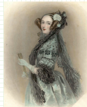
Ada Augusta Byron, contessa di Lovelace, 1838