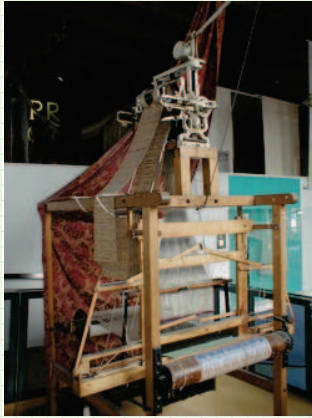
telaio Jacquard

l'idea di J.-M. Jacquard (1804): introdurre schede di cartone forato nei telai; a ogni scheda corrispondeva un preciso disegno, formato dai fori