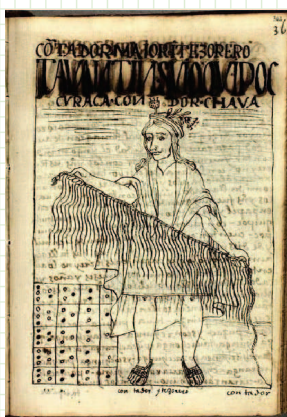
kipu e yupana

il kipu Inca: archeologia della memorizzazione dell'informazione