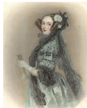
Ada Augusta Byron, contessa di Lovelace, 1838

Sketch of the Analytical Engine di L. F. Menabrea, tradotto e corredato di ricche note da Ada Lovelace, "prima programmatrice della storia"