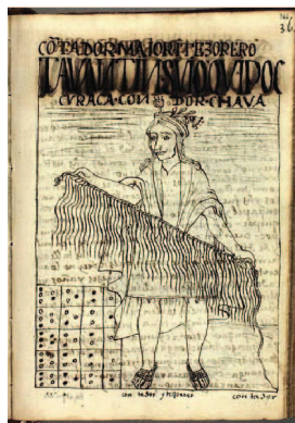
kipu e yupana

il kipu Inca: archeologia della memorizzazione dell'informazione